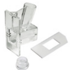
Zyto-Kammer 1536 (12 St.) (wiederverwendbar) für große Volumina bis 6 ml (z.B. Urinproben) Dichtung 1537 (100 St.) für Zyto-Kammer 1536