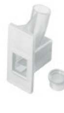
Zyto-Kammer 1533 (500 St.) Zyto-Kammer 1535 (100 St.) für Volumina bis 6 ml (z.B. Urinproben)