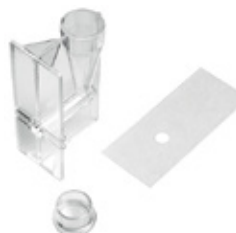
Zyto-Kammer 1538 (12 St.) (wiederverwendbar) für Probenmengen bis 500 µl Filterkarte 1539 (200 St.) für Zyto-Kammer 1538