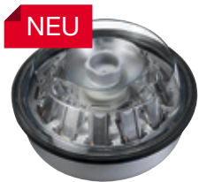
12-fach Rotor 1515-A Deckel mit Bioabdichtung*