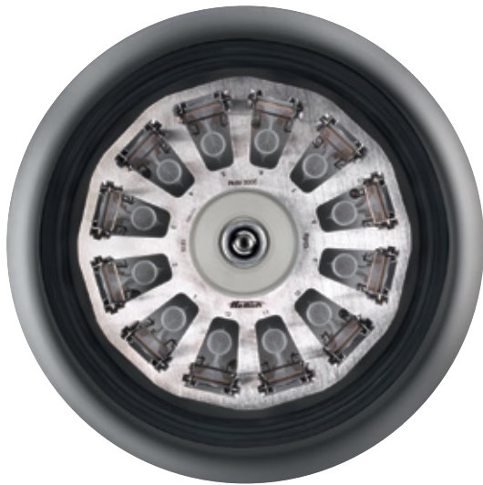
Blick in den Schleuderraum zeigt Rotor 1515-A mit 12 Zyto-Einsätzen