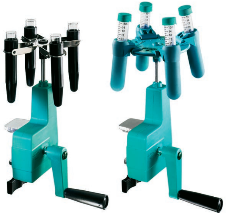
abgebildet mit Rotor 1014 ↘ 90°

Rotor 1025 nimmt darüber hinaus zahlreiche gängige Probenröhrchen, auch mit Rundboden, bis 15 ml auf. Die Länge der Röhrchen kann max. 125 mm betragen, der Durchmesser max. 17 mm.