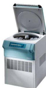
ROTANTA 460 RF