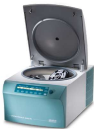
ZENTRIMIX 380 R