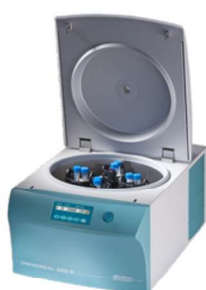
UNIVERSAL 320 R

Modèles réfrigérés et cryothermostatés :