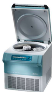
ROTANTA 460 RC

Modèles réfrigérés et cryothermostatés :