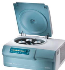
ROTINA 420 R