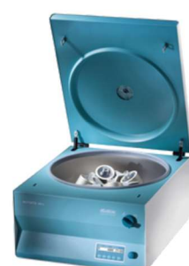
ROTOFIX 46 H