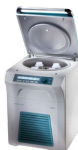
ROTIXA 500 RS