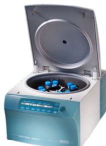
ROTINA 380 R