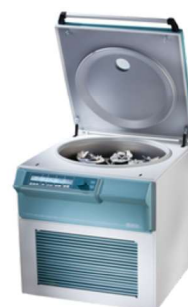
ROTOSILENTA 630 RS