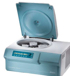
ROTANTA 460 R