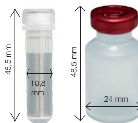
Gefäße für die Liposomenherstellung (2 ml und 10 ml)