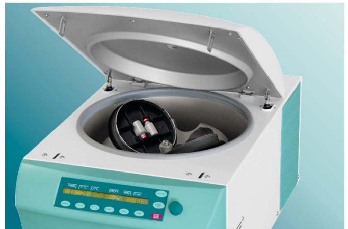
ZentriMix 380 R

Aufgrund der sehr raschen Herstellung können auch Liposomen mit geringer Lagerstabilität hergestellt und zeitnah verwendet werden.